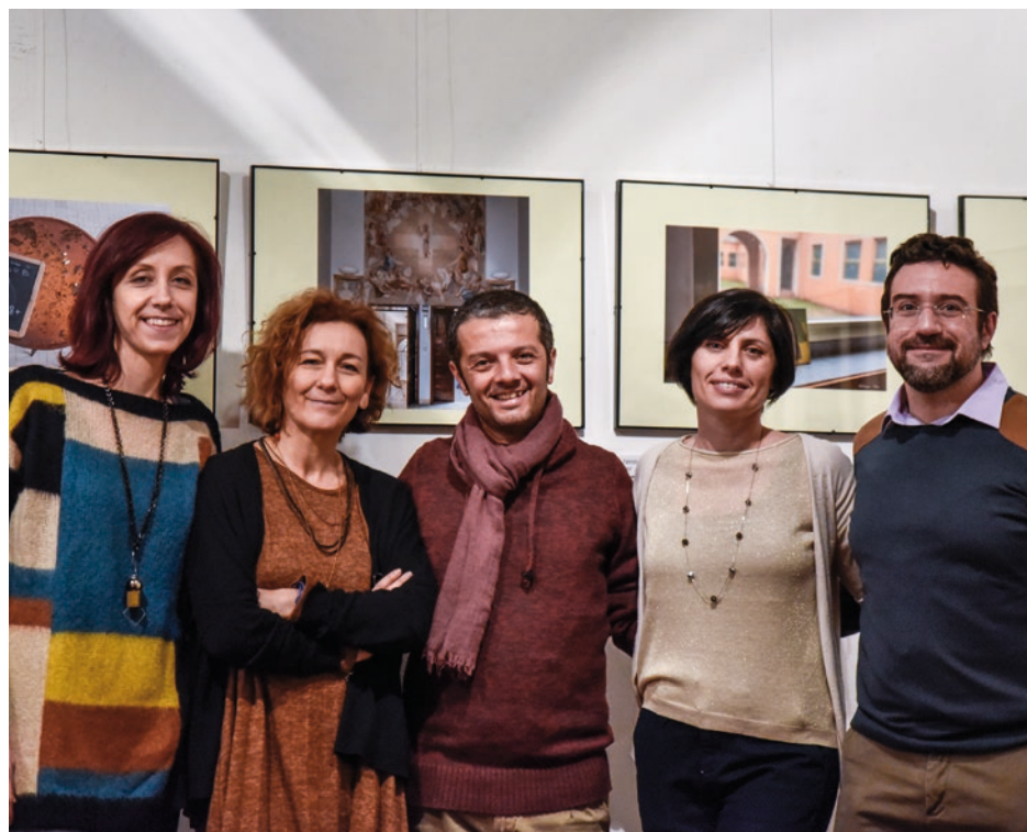
A SINISTRA, UNO DEGLI SCATTI CHE HA PARTECIPATO AL CONCORSO "CARTOLINE DAL SANTARELLI". A DESTRA, L'ASSOCIAZIONE POSTCARDS AL COMPLETO.

E nel futuro cosa c'è? “Usciremo dai confini di Forlì con iniziative fotografiche dedicate al comprensorio , riproporremo la caccia al tesoro in costume d'epoca e stiamo lavorando a una mostra che avrà caratteristiche del tutto nuove rispetto a quanto già visto fino ad ora e sarà dedicata ai luoghi religiosi di Cesena”.